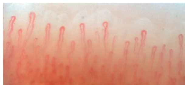
Figura 2 – Capilaroscopia en fenómeno de Raynaud primario: capilares en forma de «U» invertida, con espacio uniforme entre los capilares, sin hemorragias, megacapilares y neovasascularización (capilaroscopia Optilia, aumento x200).

El principal hallazgo de este estudio fue que, en pacientes con FR, se encontró EAS en un 19,2%, encontrándose hallazgos particulares en la VLU y en los ANA. Este es un resultado llamativo y poco explorado en la literatura; la mayoría de la información se enfoca en modelos pronósticos y de transición de FR primario a secundario que incluyen estas herramientas diagnósticas 12,13 . Bernero et al. analizaron 2.065 pacientes