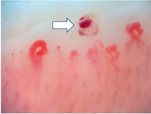
Figura 4 – Presencia de patrón activo de esclerosis sistémica: mayor número de megacapilares y de hemorragias –flecha– (capillaroscopia Optilia, aumento \times 200 ).