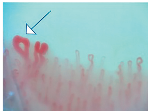
Figura 3 – Patrón temprano de esclerosis sistémica: presencia de megacapilar (capilar con diámetro mayor de 50 \mu m –flecha–) (capilaroscopia Optilia, aumento x200).

con FR primario, encontrando que 565 (27,3%) de ellos tenían hallazgos videocapilaroscópicos basales, pero no se hace una descripción de estos y no se mencionan los ANA 23 . Secchi