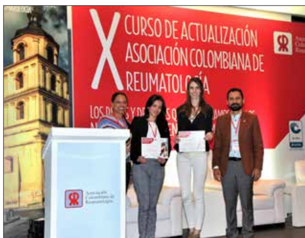
▲ Entrega de reconocimientos a mejores ponencias.