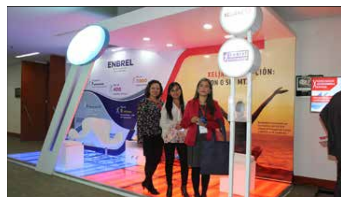
▲ Muestra Comercial.