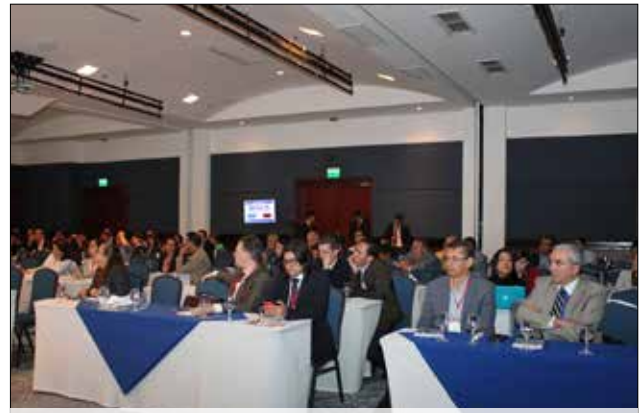
▲ Gran asistencias a conferencias del XCAR.