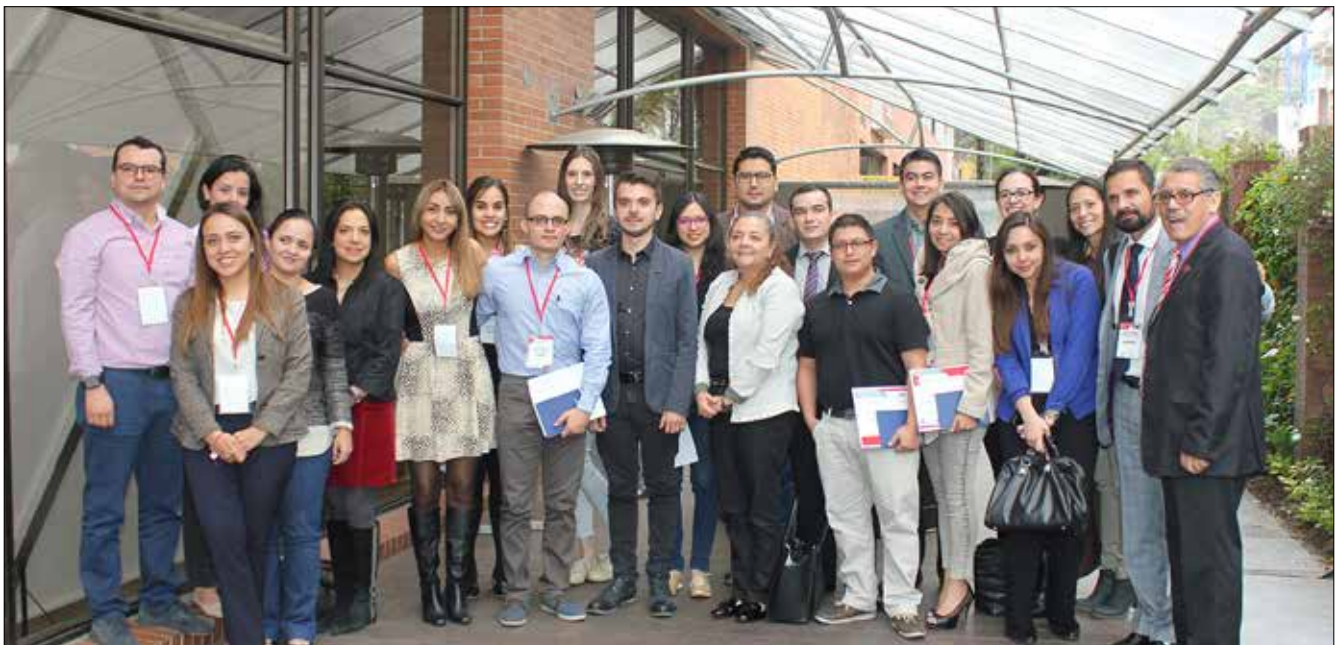
▲ 1er Simposio de residentes de los programas colombianos de reumatología.

Asoreuma, es sin duda un gran reconocimiento al promover y dedicar sus esfuerzos en la mejora continua del campo reumatológico.