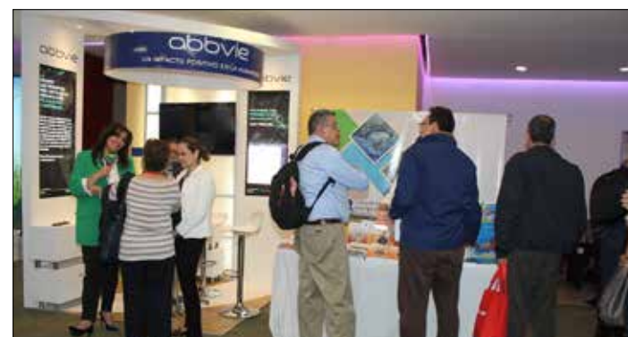
▲ Muestra Comercial, espacios de actualización.

La Asociación Colombiana de Reumatología, es sin duda la celebración a su mayor compromiso en dedicar sus esfuerzos en la mejora continua tanto del campo reumatológico como de su población colombiana.