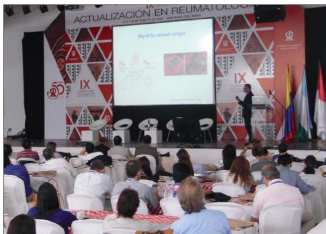
▲ Ponencias, Plenaria y Talleres especializados fueron parte del contenido académico del IX CAR.

Durante el pasado 4 al 6 de agosto se realizó en Montería el IX Curso de Actualización en Reumatología, fué un evento de carácter nacional donde se trataron temas científicos de interés en torno a la reumatología como el síndrome de Sjögren y esclerosis sistémica, entre otros importantes temas. 🌸