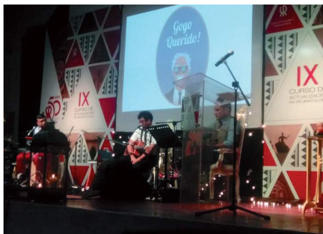
Presentaciones artísticas de alto valor cultural hicieron parte de la agenda.